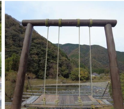
▲川沿いのブランコ