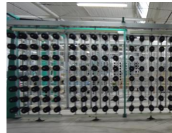
▲縦糸の組み合わせ