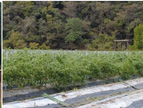
▲育てているピーマン、生食も