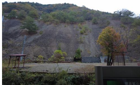
▲明延鉱山の中心地跡