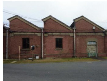
▲のこぎり屋根が残る工場