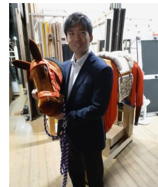
▲バックステージ体験