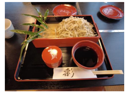
▲自ら打った赤花そばを食す