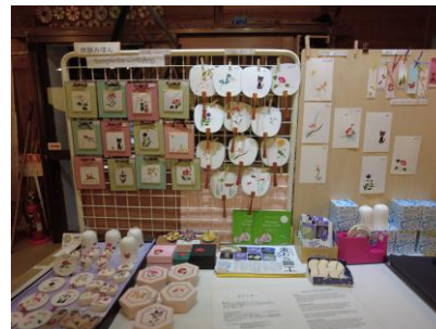
▲体験する麦わら細工の種類等