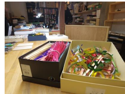
▲麦わら細工の素材