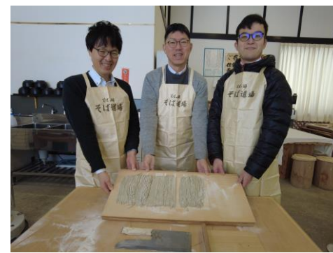
▲そば打ち、裁断を体験