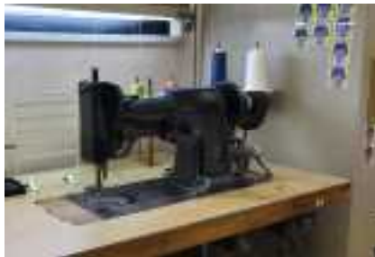
▲古くから使われているミシン（金川刺繍）