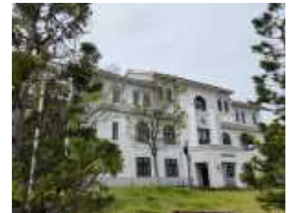
▲豊岡櫓古堂（旧豊岡町役場庁舎）