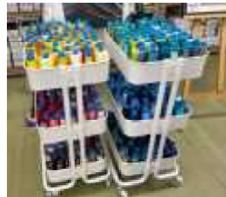
▲カラフルな糸（金川刺繍）