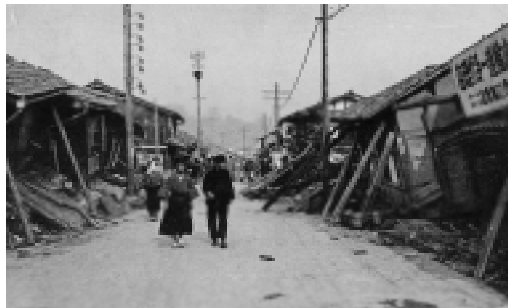
▲豊岡駅前の倒壊した家屋