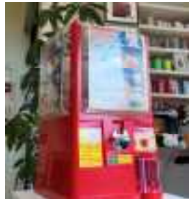
▲コラボ製品のガチャも