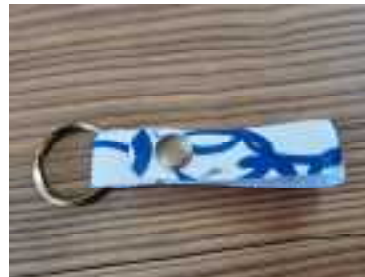
▲唯一無二のキーホルダー