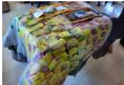
▲障がい者のアート作品