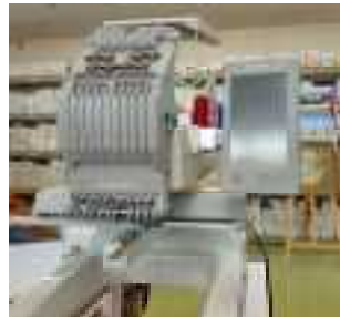
▲移動式の刺繍ミシン（金川刺繍）