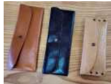
▲制作したペンケース