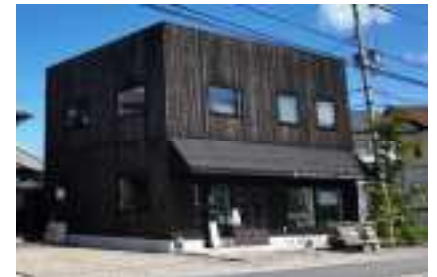
▲体験店舗の一つ「革の森」