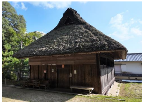
▲下谷上農村歌舞伎舞台