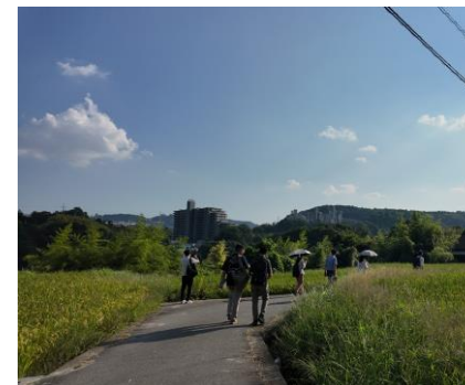
▲高層建築物と農村