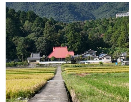
▲拠点の一つ・成道寺