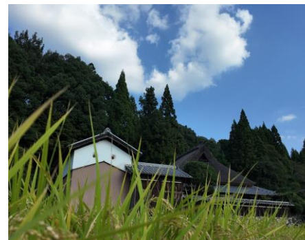
▲農村風景に溶け込む