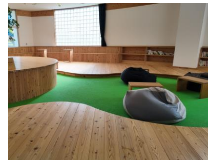
▲コワーキングスペース