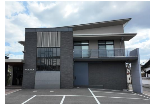
▲マッチの里ミュージアム)