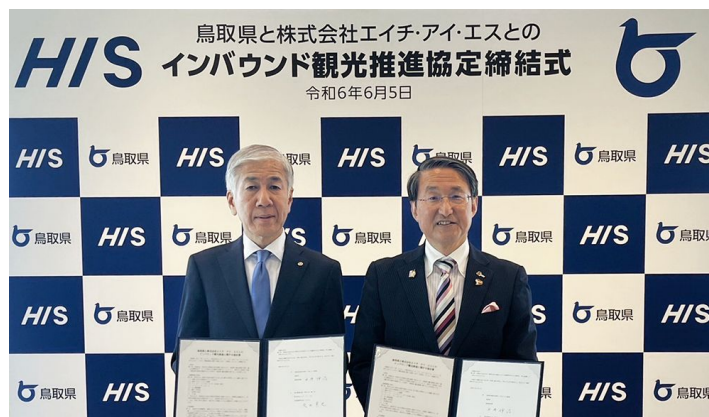
2024年6月 インバウンド観光推進に関する協定を締結 (連携事業地域を 全世界 に拡大)

2019年に東南アジア・南アジア地域を対象とした「インバウンド観光推進に関する協定」を締結。コロナ禍による停滞期間を経て、2023年には「HIS すなば国 訪日レップオフィス」を開設し、コロナ後における鳥取県へのインバウンド誘客を再開。以降、東南アジアにとどまらず、米国、カナダ、欧州各国へとターゲット市場を拡大し、鳥取県の認知向上と魅力発信、送客に尽力。そして、2024年には連携範囲を全世界へと広げる新たな協定を締結し、さらなる観光振興を図っています。