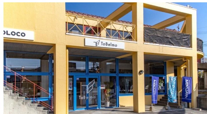
2023年8月「HIS すなば国 訪日レップオフィス」を開設 (コロナ後の鳥取県へのインバウンド誘客を再スタート)