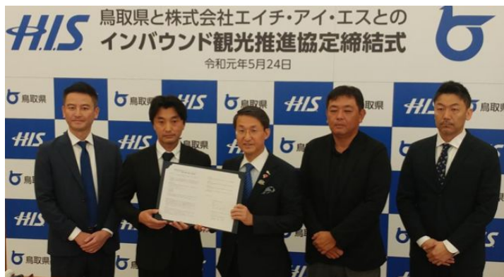
2019年5月 インバウンド観光推進に関する協定を締結 (東南アジア地域の訪日観光需要の獲得に向け連携)